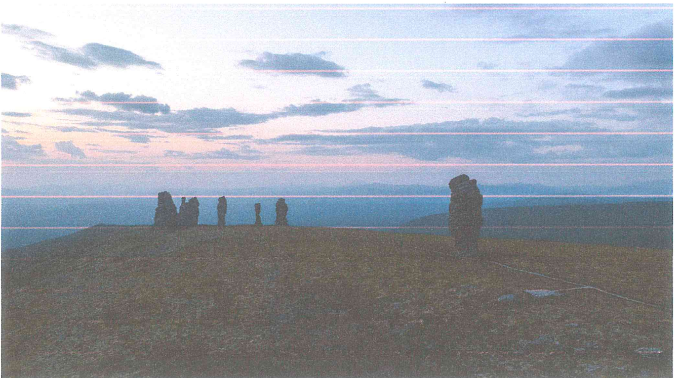
4 – Останцы на плато Маньпупунёр. Автор Смирнов Н.С.