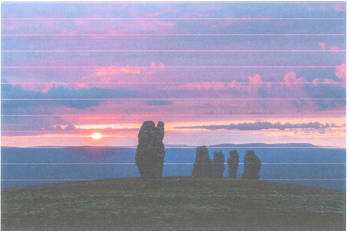
3 – Останцы на плато Маньпупунёр.