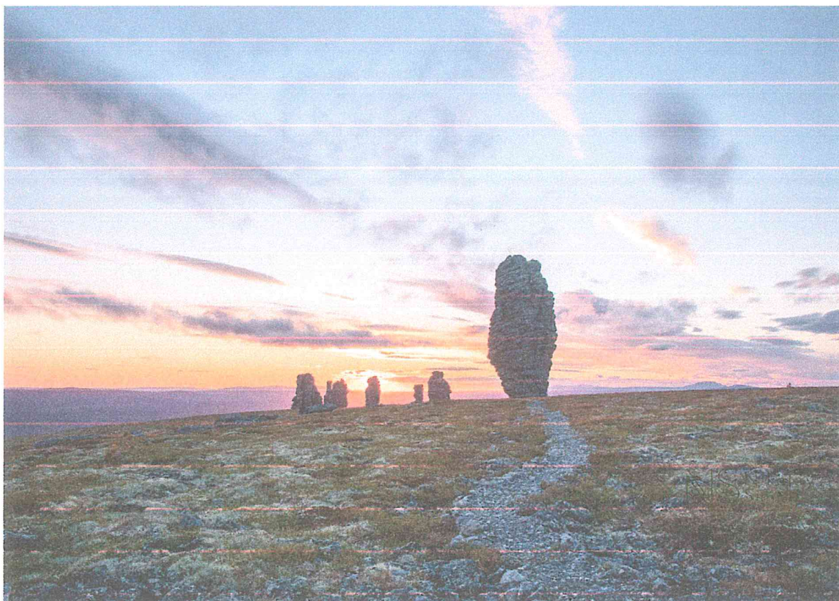
1 – Останцы на плато Маньпупунёр. Автор Смирнов Н.С.